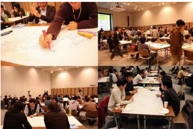
コラボレーションカンファレンス2010in福岡