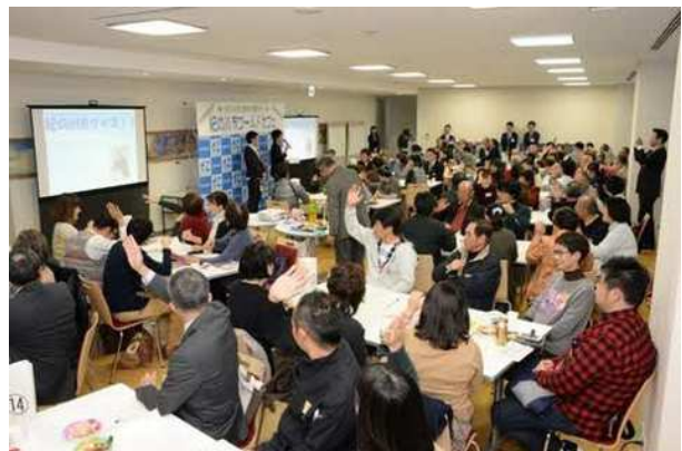
紀の川市ワールドカフェ