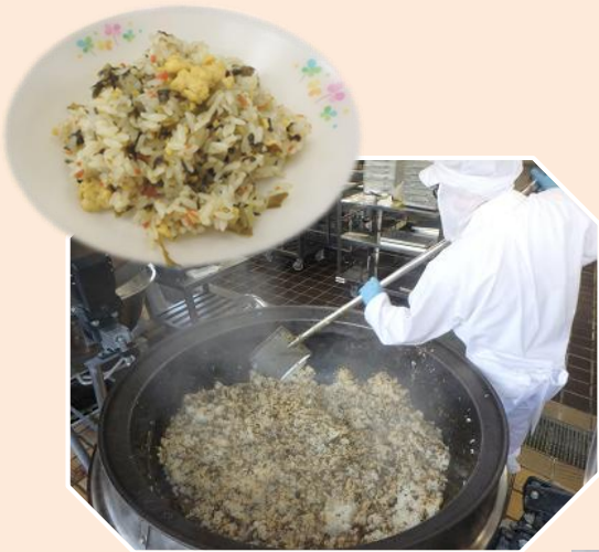
熊本産の高菜漬けを たっぷり使った「高菜飯」♪