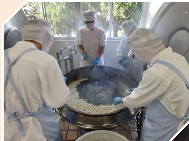
「だご汁」のだんごは ひとつひとつちぎって…