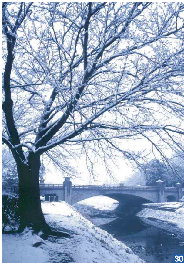
30 南浅川橋（長房町ほか） 南浅川に架り、多摩御陵（武蔵陵墓地）への参道となっている。昭和11年（1936）架橋。