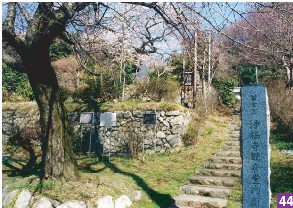
44 浄福寺（下恩方町） 寺と裏山を含めた一帯には、14～15世紀の城郭と言われる浄福寺城跡がある。春には見事なしだれ桜も咲く。