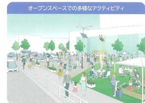
まちの将来イメージ