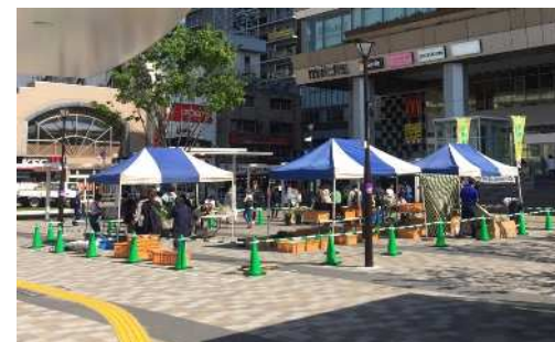
地元農産物の販売 (区画の貸出)