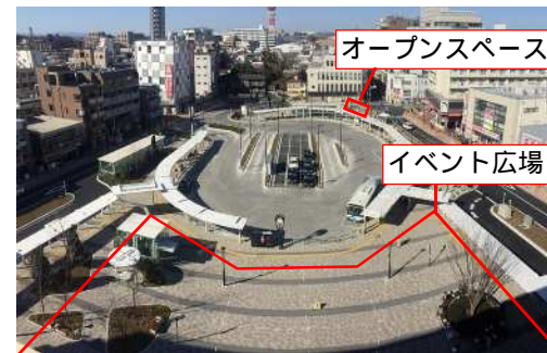
広場全景