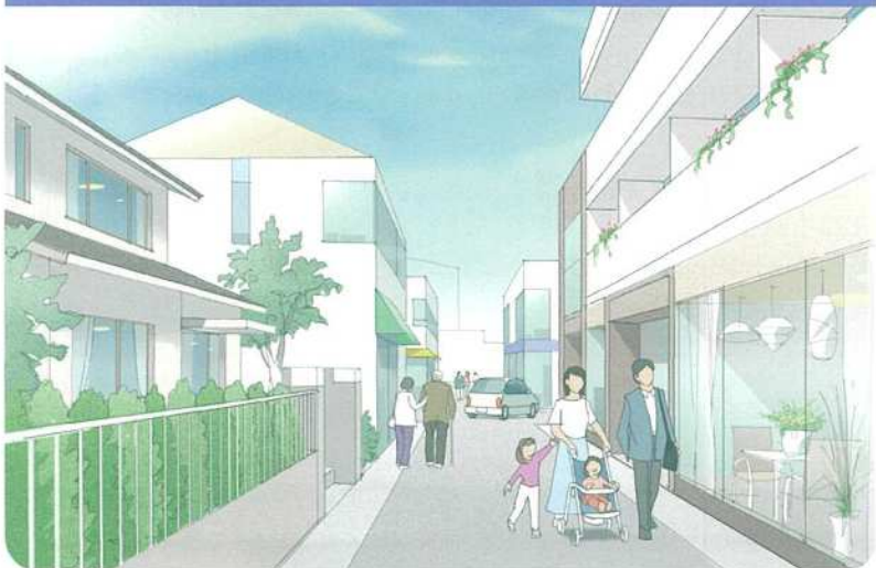
新たな土地利用と既存環境の融合