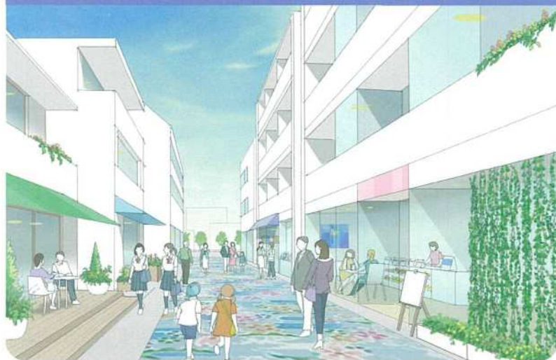
心地よく歩きたくなる空間