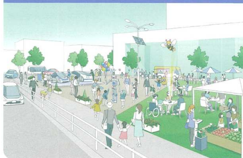
オープンスペースでの多様なアクティビティ