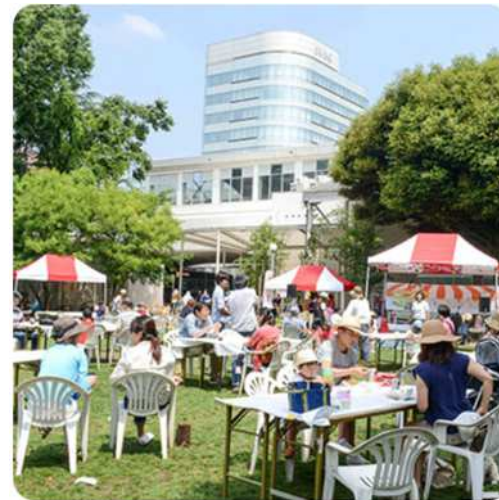
のんびりとした休日の朝を楽しむ人々