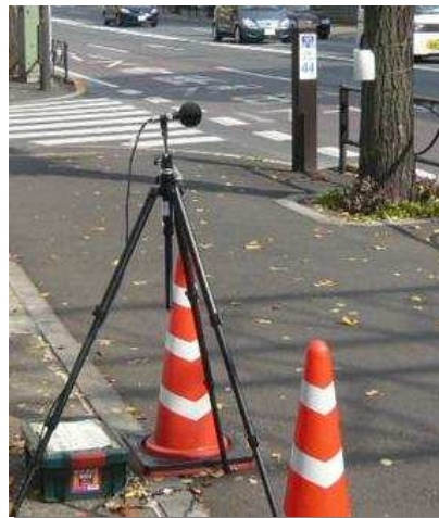
道路交通騒音測定

発生源である自動車の低騒音化や、道路の低騒音型舗装等の対策により一層の推進が求められます。