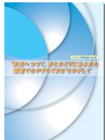
八王子市環境基本計画改訂版

なお、計画策定から5年が経過した21年度には、これまでの施策や事業の進捗状況などを踏まえ、計画全体の間見直しを行いました。