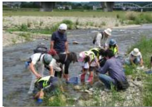
浅川での水質調査

具体的な活動としては、身近な自然環境をその地区の皆さんに見て、知って、直接感じていただくこと、自然体験講座を開催するほか、小学生を対象にした環境教育支援の実施、大気測定や水質検査、あるいはごみの分別講座や省エネ教室などといった専門的な活動から、市民に密接した活動まで、その活動の範囲は広域化し、本市の環境保全活動の先駆けとなっています。