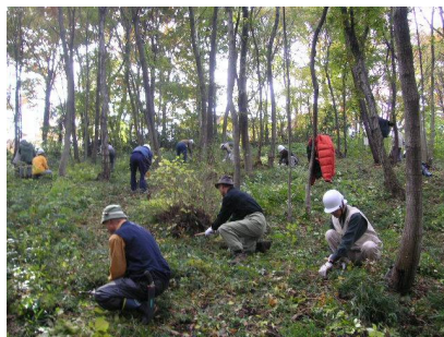
身近にある樹林地の下草刈り

会員は、その地区の環境が良くなるよう地域にあるさまざまな団体と連携し、保全活動に努めています。また、その地区の良好な環境の確保のため、目標を定めて環境基本計画・地域行動編に掲げ、主体的に活動するとともに、その活動の結果を評価し、必要に応じて計画を見直したりしています。