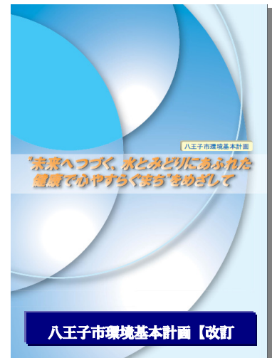
八王子市環境基本計画改訂版

環境の世紀と呼ばれる21世紀の初頭2001年(平成13年)を「環境元年」と位置づけ、環境保全に取り組む基本となる考え方を「環境基本条例」として制定しました。平成16年3月には、市民・事業者の皆さんとの協働作業により「環境基本計画」を策定しました。