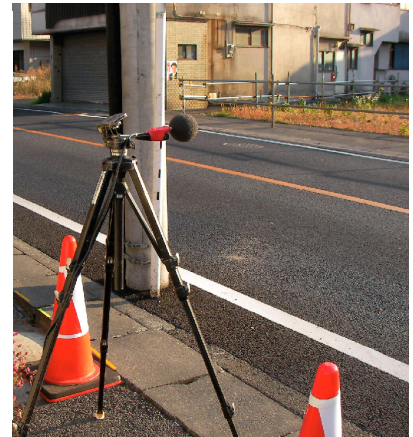
道路交通騒音測定