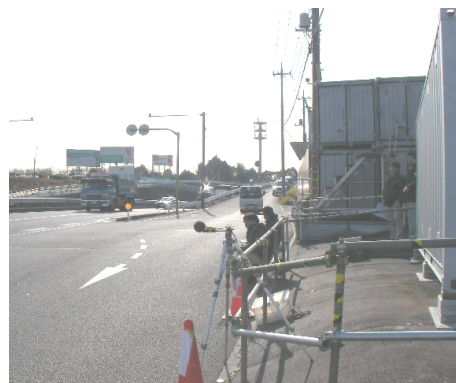
道路交通騒音測定

発生源である自動車の低騒音化や、道路の低騒音型舗装等の対策のより一層の推進が課題です。