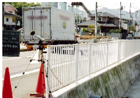
道路交通騒音測定

発生源である自動車の低騒音化や、道路の低騒音型舗装等の対策のより一層の推進が課題です。