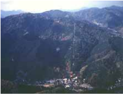
八王子を代表する山 高尾山

今日の環境問題は、身近な日常生活や通常の事業活動が原因となって生じる河川の水質汚濁や大気汚染などの従来の問題から、大量生産、大量消費、大量廃棄といった社会経済活動による環境への負荷、さらには、地球温暖化やオゾン層の破壊など地球規模の問題まで拡がり、複雑で多様化しています。