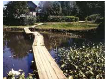
水とみどり豊かな片倉城址公園

平成15年度には、このしくみを活かし、市民・事業者の皆さんとの協働作業により「環境基本計画」を策定しました。この計画により、市と市民・事業者の皆さんが共通の目標である望ましい環境像に向かい、八王子のより良い環境づくりを推進していきます。