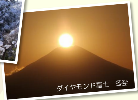
ダイヤモンド富士 冬至