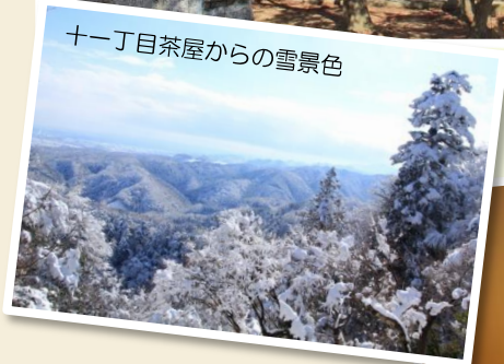
十一丁目茶屋からの雪景色