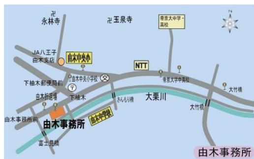
< 由木事務所所在地 >