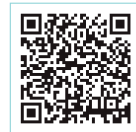
Trang web về bản "Hướng dẫn bổ sung"

Bản "Hướng dẫn bổ sung" được viết bằng 9 ngôn ngữ gồm tiếng Anh, tiếng Trung, tiếng Việt, v.v.