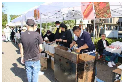
いろいろな店を出展しました