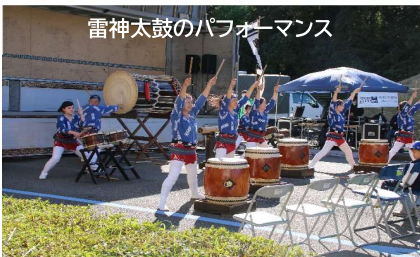
雷神太鼓のパフォーマンス