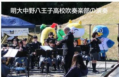
明大中野八王子高校吹奏楽部の演奏