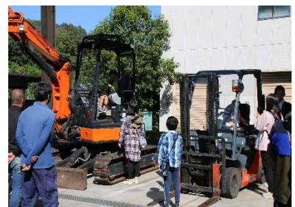
工場のクルマに乗ってみよう