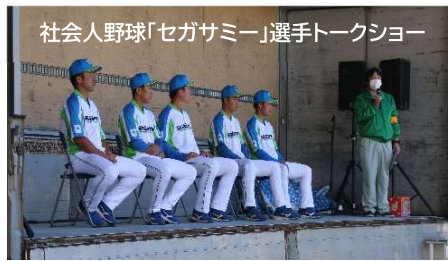
社会人野球「セガサミー」選手トークショー