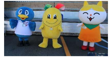
戸吹クリーンセンター マスコットキャラクター「ブクリン」(中央)