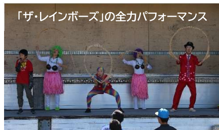
「ザ・レインボーズ」の全カパフォーマンス