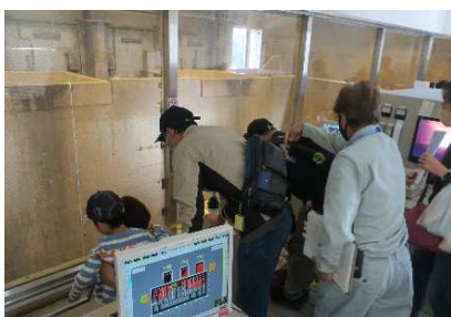
工場見学(奥はごみピット)