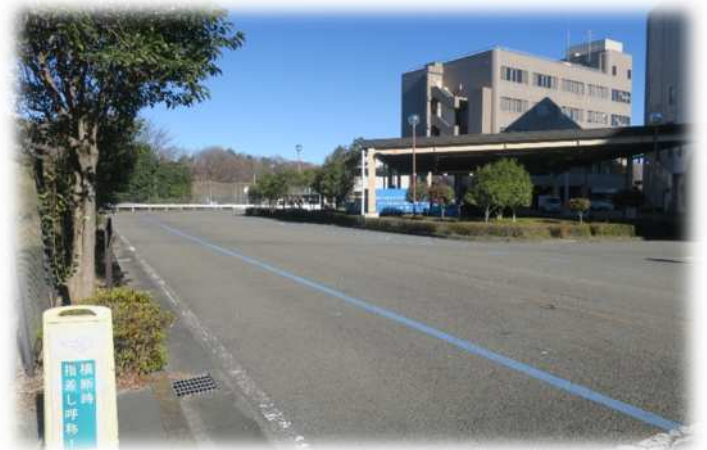
事前予約制開始後(令和4年(2022年)年末)