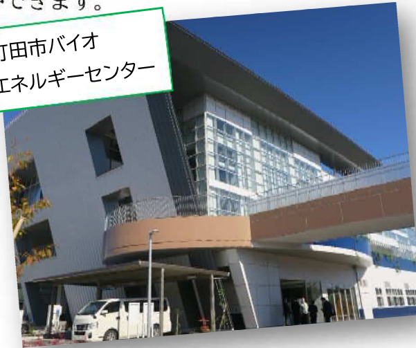
町田市バイオ エネルギーセンター

地元対策協議会の視察で 11 月 8 日(火)に町田市バイオエネルギーセンターと館クリーンセンターを見学しました。町田市バイオエネルギーセンターは令和 4 年(2022 年)1 月から稼働しており、生ごみのバイオガス化施設とごみ焼却施設を一体的に整備した首都圏初の施設です。バイオガスとは、微生物が生ごみなどを発酵させることにより発生するガスのことです。ガスを発電や熱の供給などエネルギーとして利用することで、二酸化炭素の排出量を減らすことができます。