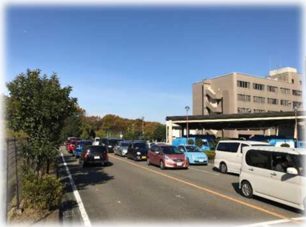
事前予約制開始前(平成30年(2018年)年末)