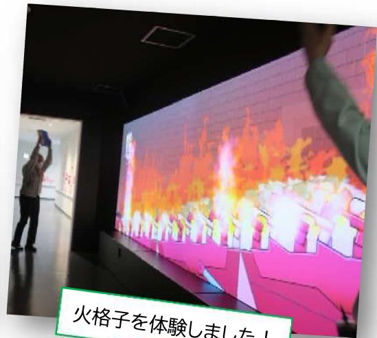
火格子を体験しました!