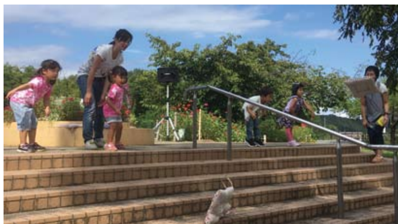
子ども達が座布団飛ばし大会に参加