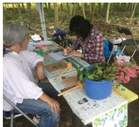
パウロの森 アイ染め体験