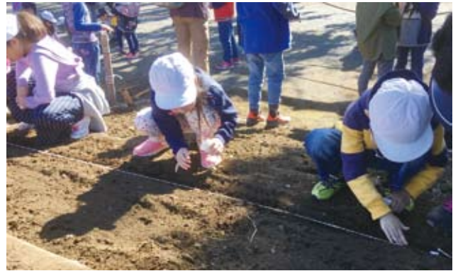
恩方第一小2年生が菜の花の種を撒いてくれました