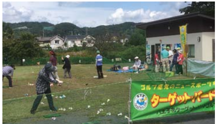
ターゲットバードゴルフ体験