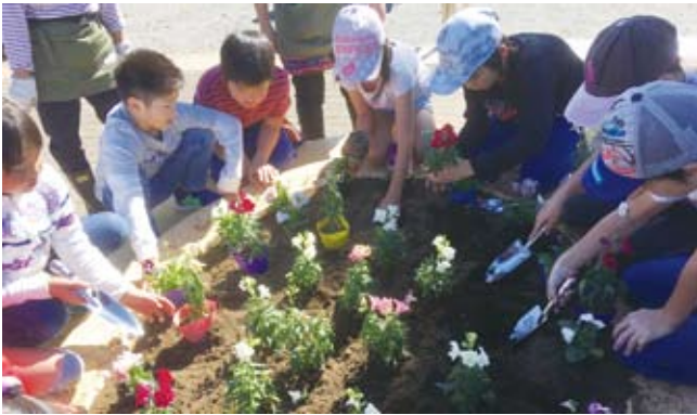
元木小3年生が亀の日時計花壇に花の苗も植えてくれました

11月には元木小学校3年生と、恩方第一小学校2年生の児童達が、川沿い散策路の斜面に菜の花の種を撒いてくれました。3月のさくら祭りの頃には、公園が黄色に色づくとうれしいですね！