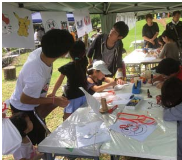
凧づくりのボランティア生徒たち