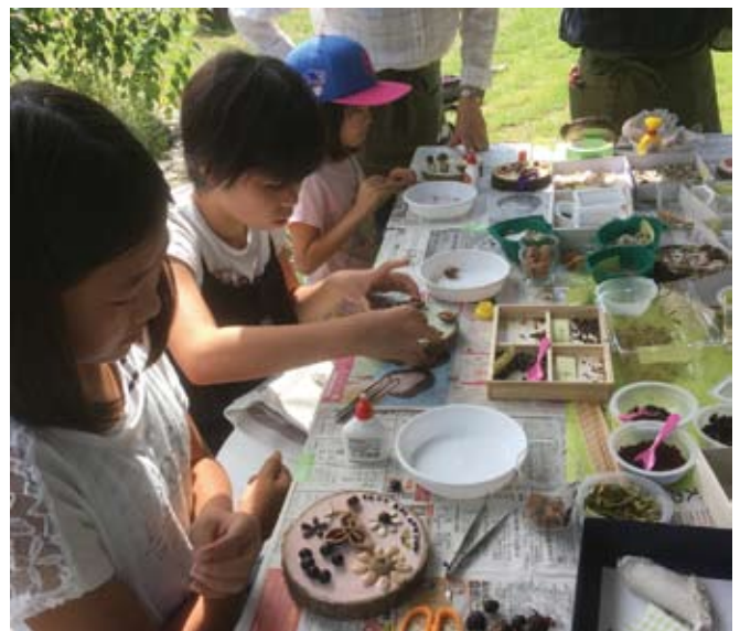
タネでアートの様子 真剣につくってます！