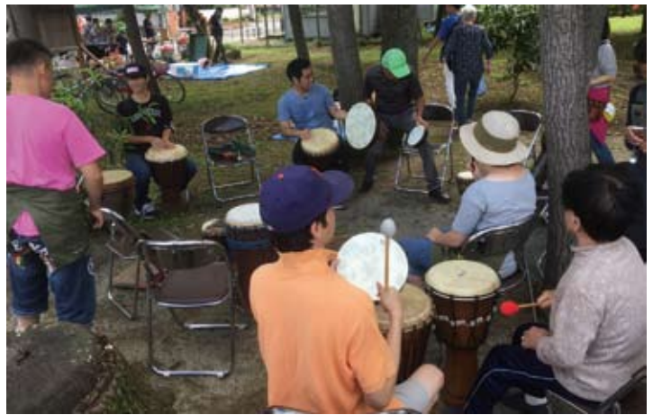
ドラムサークル 「まこりんと太鼓で遊ぼう」