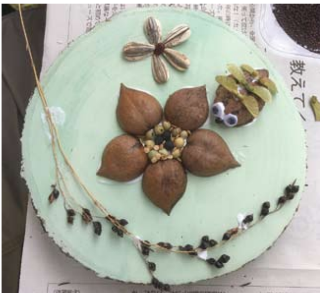
タネでアートの作品