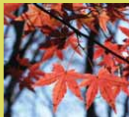
秋の植物 ハギ、フジバカマ、ウメドモドキなど

カエデ科 花期：4～5月 紅葉：11～12月 モミジの仲間には多くの野生種があり、そこから多様な園芸品種が作出されました。本庭園にはイロハモミジのほかオオサカズキ、ウゴン、シタシモミジなどが植栽されています。