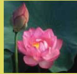
夏の植物 アジサイ、サルズベリ、キキョウなど

ハス科 花期：7～8月 インド原産の多年生水生植物。極楽浄土に咲く花として、仏教伝来とともに広まり、鑑賞や食用に栽培されるようになりました。花は1日花よく言われますが、実際には3～4日間開花を繰り返して、やがて散っていくようです。