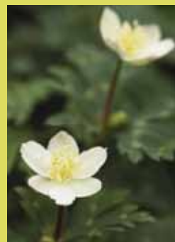
春の植物 シタレザクラ、ハナモモ、ボタン、フジ、オオチゴユリ、カンアオイ類など

キンポウゲ科 花期：4～5月 山地から丘陵地にかけての潤った林縁、土手などに群生する多年草です。茎の先端に2輪の花が順を追って開花します。1輪や3輪のものもあります。