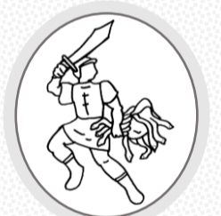
星座絵：ペルセウス座(イラスト)

ペルセウスの星座絵には右手に剣を、左手に討ち取ったメデューサの首を持つ姿が描かれています。