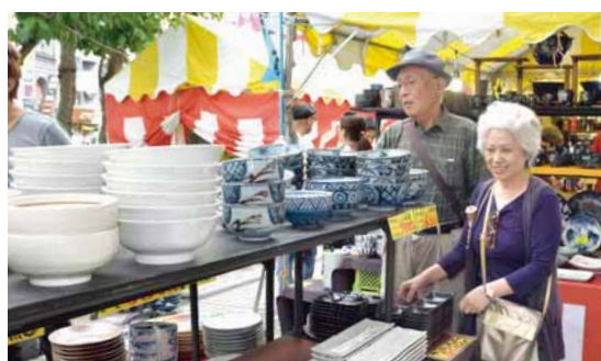
▲有名産地の焼き物が勢ぞろい

問い合わせ 八王子商工会議所(☎623・6311、☎626・8138)、または観光課(☎620・7378、☎627・5951)へ