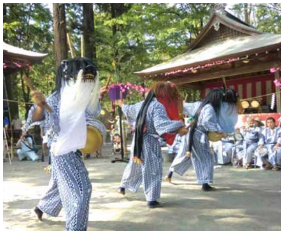
▲市指定無形民俗文化財「小津の獅子舞」

日時 11月8日(日)午後2～4時 内容 「八王子車人形」「説経浄瑠璃」「獅子舞」の公演など 会場 オリナスホール八王子 定員 1,800名(先着順)