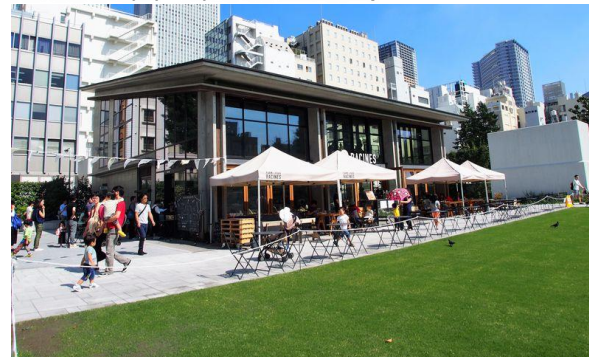
南池袋公園 (東京都豊島区)