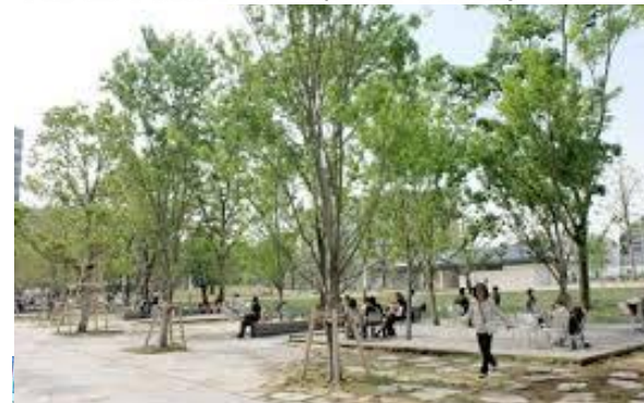
中野セントラルパーク (東京都中野区)