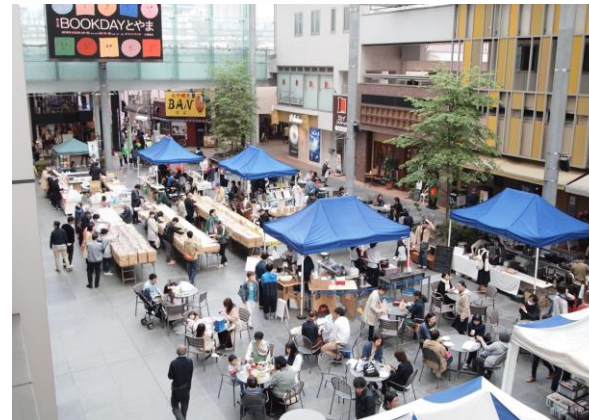
富山グランドプラザ (富山県富山市)