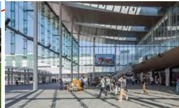
福井市賑わい交流施設 (福井県福井市)