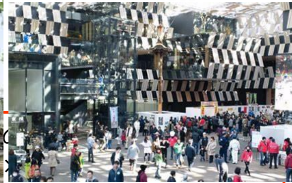
アオーレ長岡 (新潟県長岡市)