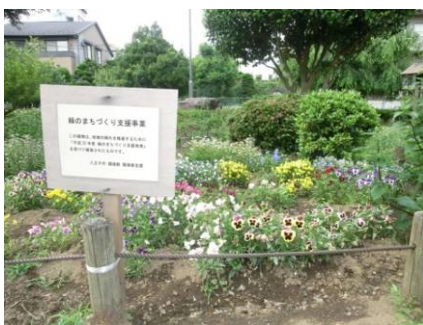
緑のまちづくり支援事業

このような、地区の魅力を向上させる取り組みに対し、今後も積極的に支援していきます。