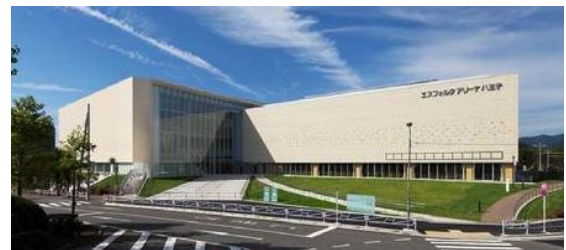
PFIを活用して整備したエスフォルタアリーナ八王子（八王子市総合体育館）

○市が保有する施設を、市民ニーズを踏まえて、他の用途へ転用したり、適正な管理を行うことで、財産の有効活用を図っています。