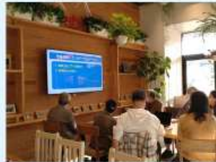
コミュニティスペースにあるモニター