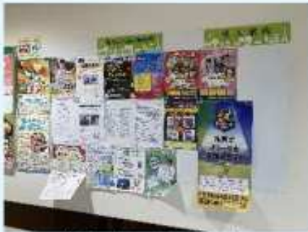
施設内にある掲示板

大型商業施設(コピオ長房)と連携し、施設内の掲示板上モニターを活用した情報発信ができるよう調整を進めてきました