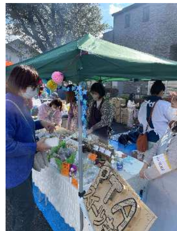
川口マルシェの様子

地域づくりの担い手となる人やさまざまな情報が集まる場として、「川口マルシェ」を川口やまゆり住民協議会と共同で開催しました。