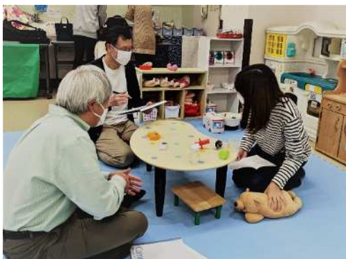
聞き取り調査の様子