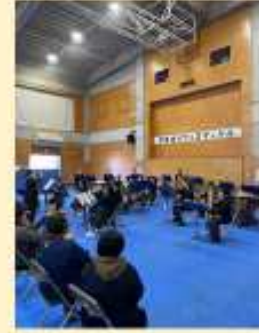
川口マルシェの様子