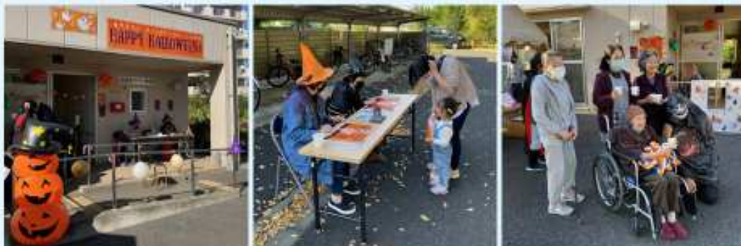
多世代交流イベントの様子