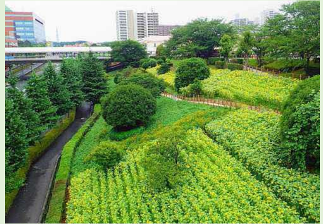
▲多摩ニュータウン通りのひまわり

南大沢八幡神社の「例大祭」として、平成28年(2016年)に24年ぶりとなる夏祭りが復活しました。模擬店や子供神輿等で賑わいます。 また、三井アウトレットパーク多摩南大沢と多摩ニュータウン通りの間の斜面には、一面にひまわりが咲き誇ります。