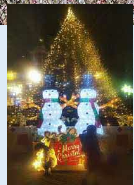
▲南大沢駅前のクリスマスイルミネーション

冬には、南大沢駅前のアーケードにクリスマスイルミネーションが点灯され、駅前を華やかにしてくれます。