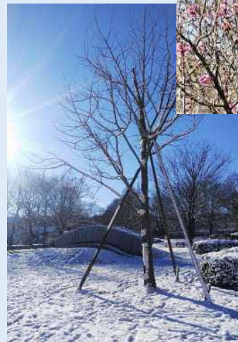
▲中郷公園の雪景色