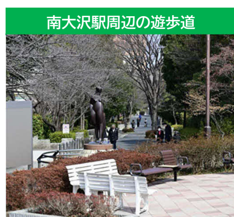
南大沢駅周辺の遊歩道

道路や公園、遊歩道等が計画的に整備され、住宅街の中には多くの自然が残っています。公園、緑地では、南大沢駅北側の東京都立大学南大沢キャンパスや、駅前南側の中郷公園、南大沢二丁目の南端部に位置する清水入緑地等があり、四季折々の自然を楽しむことができます。