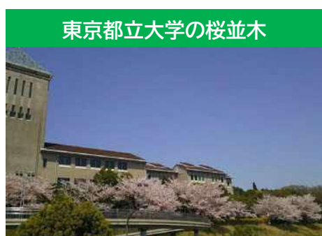
東京都立大学の桜並木