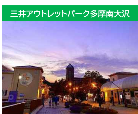
三井アウトレットパーク多摩南大沢

南大沢駅周辺が遊歩道でつながっており、安全・快適に歩くことができます。そのため駅までの(からの)交通手段で最も多いのは徒歩となっています。駅前南側の交通ターミナルには、乗車バス停6か所に路線バス16系統が運行され、うち3系統は住宅地内を循環する路線となっており、平日は、朝6時から24時台まで運行しているバスシステムもあります。京王相模原線南大沢駅からは、橋本駅や新宿駅まで直接アクセスが可能です。