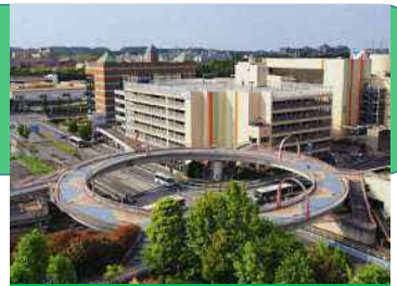
南大沢輪舞歩道橋