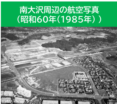
南大沢周辺の航空写真 (昭和60年(1985年))