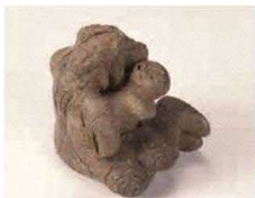
宮田遺跡の子抱き土偶

縄文時代中期の土偶。 幼子を抱いた土偶は 日本初の発見(宮田 遺跡の場所はP28・ 29「地域資源マップ」 を参照してください)