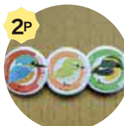
野鳥缶バッチいすれか一つ