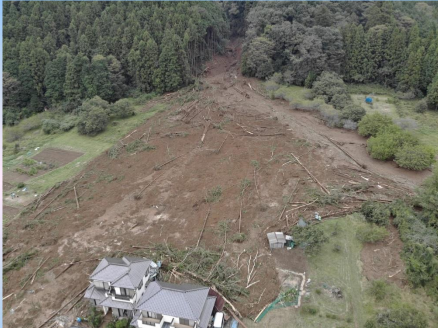
令和元年東日本台風 (上恩方町における土砂崩れ)