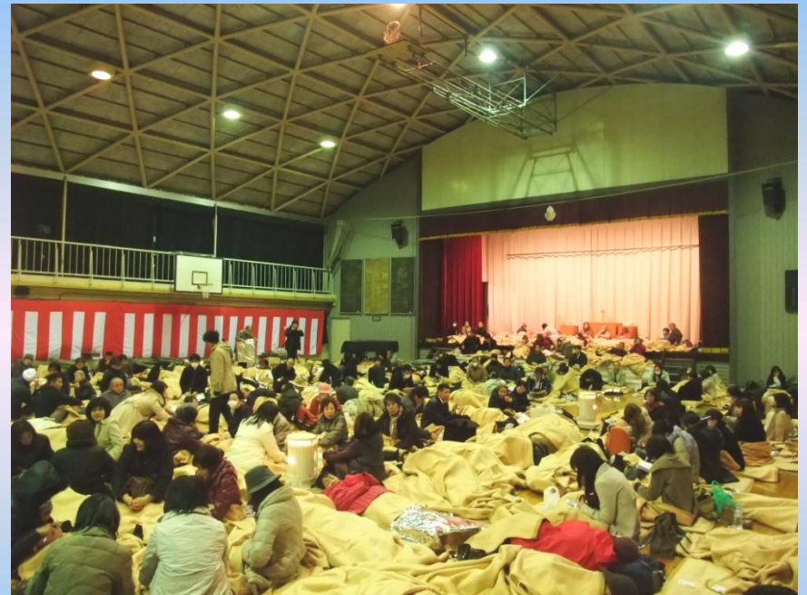
平成23年東北地方太平洋沖地震 (帰宅困難者の受入れ先として第四 小学校を開放)