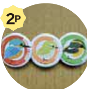
野鳥缶バッチいすれか一つ