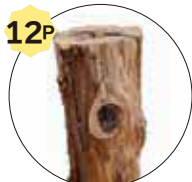
スウェーデントーチ