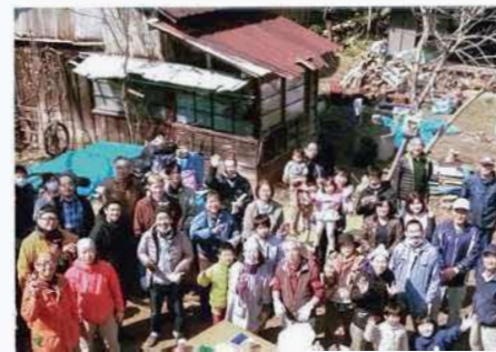
小津倶楽部の皆様

再生した古民家を拠点に、地域の豊かな自然環境を活かした農作物の収穫体験などのイベントを実施し、町の魅力を発信することで、地域の活性化に取り組んでいます。