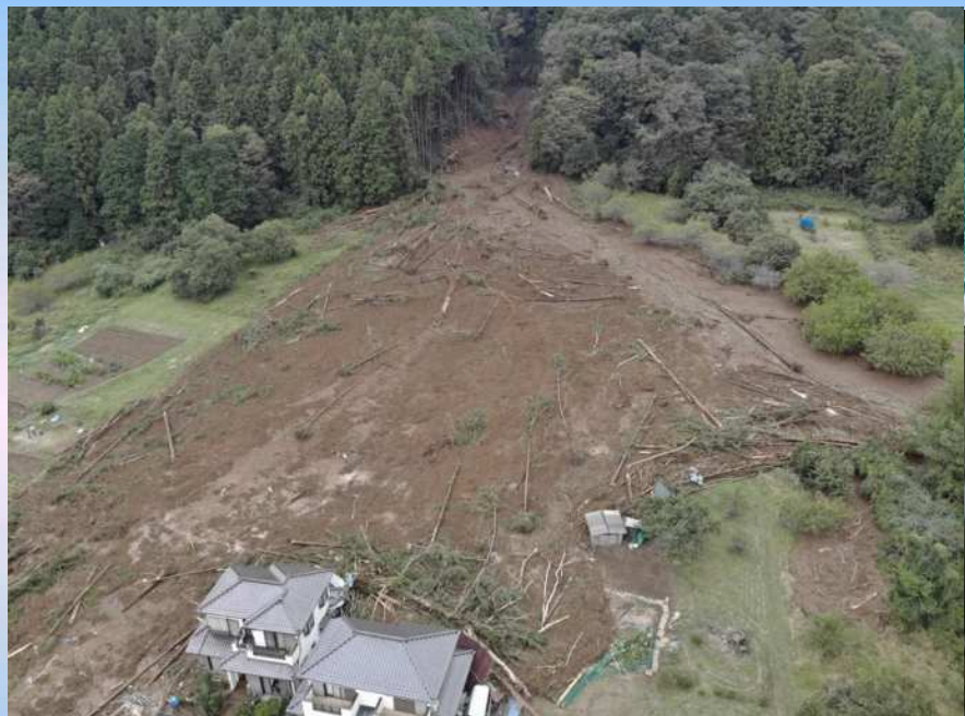
令和元年東日本台風 (上恩方町における土砂崩れ)