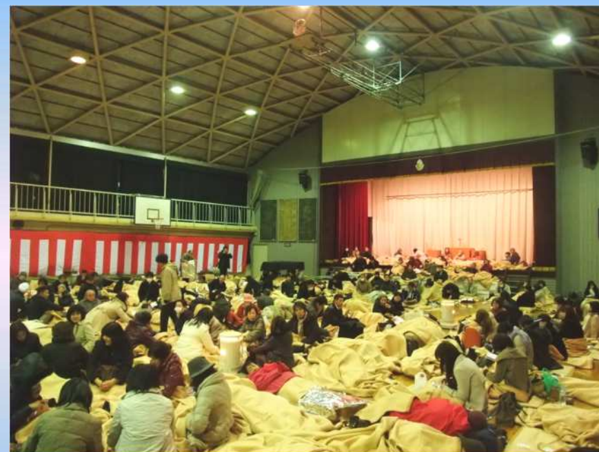
平成23年東北地方太平洋沖地震 (帰宅困難者の受入れ先として第四 小学校を開放)