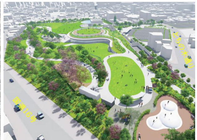
桑都の杜完成イメージ