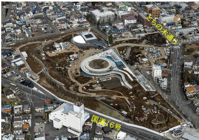
令和8年2月27日 桑都の杜工事状況

八王子市では、JR八王子駅南口に令和8年10月にオープン予定の「桑都の杜(そうとのもり)」の整備効果を高めるとともに、八王子駅周辺地区の魅力を一層向上させるため、本事業を活用し、取組の検討を進めていきます。