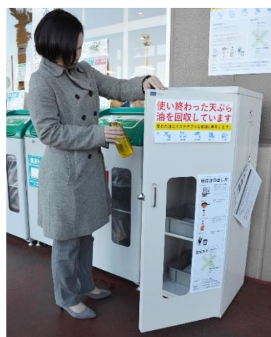
▲店頭に設置した回収ボックス