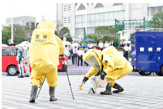
◆テロ対策訓練（イメージ）