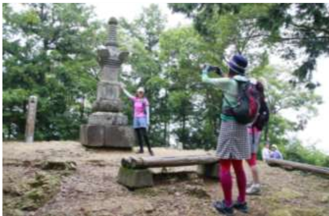
▲チェックポイントで写真を撮影して得点をゲット