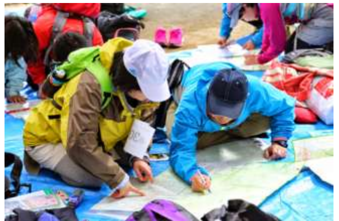
▲地図が配布されたらすぐに作戦タイム