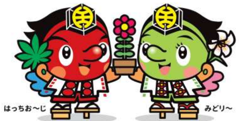
第34回全国都市緑化はちおうじフェア 公式PRキャラクター