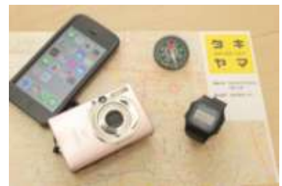
▲地図はスタート直前に配布 (カメラやコンパスは参加者が用意)

※オリエンテーリングは、チェックポイントを順番に回り、ゴールまでの所要時間を競うスポーツ。