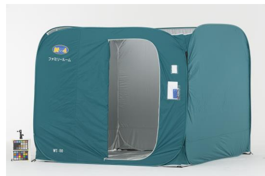
▲指定避難所135か所に各3個配備