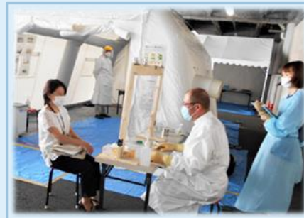
医師会医師による PCR 外来での検査

医療機関のひっ迫を防ぐため、PCR 検査に特化した専門外来を医師会の協力を得て開設し、発熱患者診療と一般診療をすみ分けることにより、市内の医療崩壊を防ぐことが出来た。