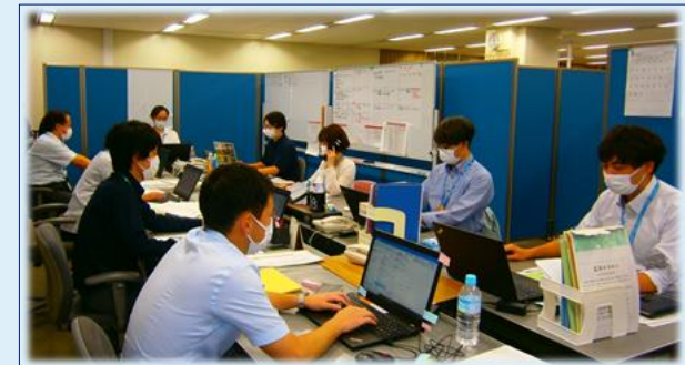
地域医療体制支援拠点

※発症から 10 日間、かつ症状軽快後 72 時間経過した患者について、原則、PCR 検査を実施せず、後方支援施設または高齢者支援施設等へ転院可能とするルール。