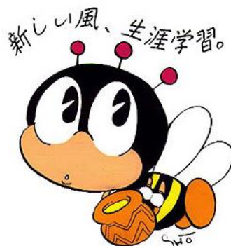
生涯学習のマスコット「マナビ」 (デザイン：石ノ森章太郎)