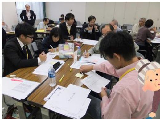
学び直し・ リカレント教育