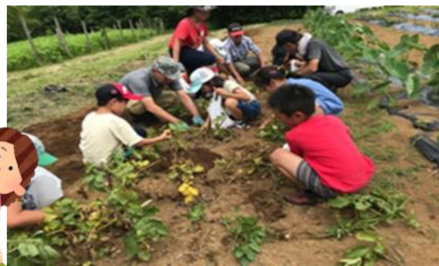
学校と家庭、地域等 との連携