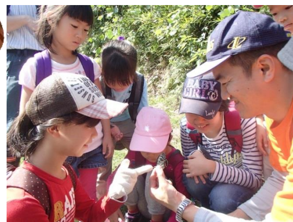
子どもの体験活動