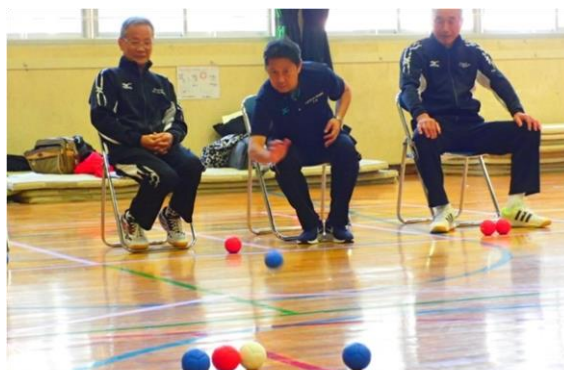
障害のある人もない人も楽しむことができるポッチャ