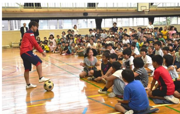
元なでしこジャパンでロンドンオリンピック銀メダリストの大野忍さんによる実演に釘づけ(オリンピック・パラリンピック教育の授業で)