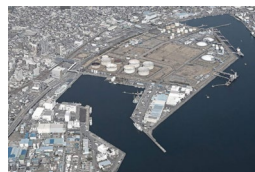
太陽光発電と大型蓄電池によるマイクログリッド（静岡県静岡市）