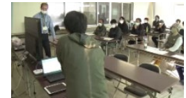
データを活用したスマート農業の取組（高知大学）