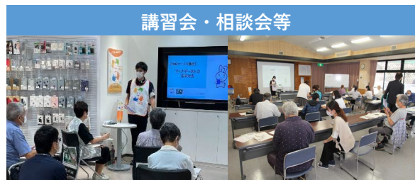
令和3年度デジタル活用支援推進事業（総務省）における講習会等の様子