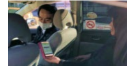
MaaSアプリを利用したタクシー配車（群馬県前橋市）