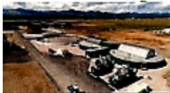
スマートなまちづくりプロジェクト（北海道上士幌町）