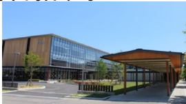
スマートシティAiCT（福島県会津若松市）