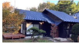
ワーケーション可能な農泊施設（イメージ）