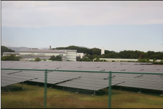
埼玉県環境整備センター

地元対策協議会の視察で11月7日(火)に埼玉県環境整備センターとツネイシカムテックス(株) 埼玉工場を見学しました。埼玉県環境整備センターは県内の市町村や中小企業などのために廃棄物の埋立事業を行っており、埋立跡地は公園やメガソーラーに活用しています。ツネイシカムテックス(株) 埼玉工場では焼却灰を無害化して、資材として活用できる人工砂にリサイクルしています。