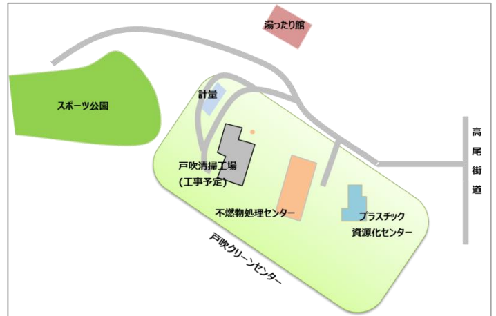
図 1：戸吹クリーンセンター全体図

戸吹クリーンセンター内の他施設(不燃物処理センター及びプラスチック資源化センター)については、通常通り見学可能ですので、御予約、御相談は戸吹クリーンセンター(042-692-5389)まで御連絡ください。