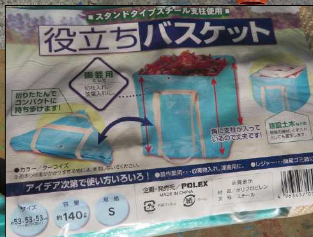
③④バスケット(ズタ袋)