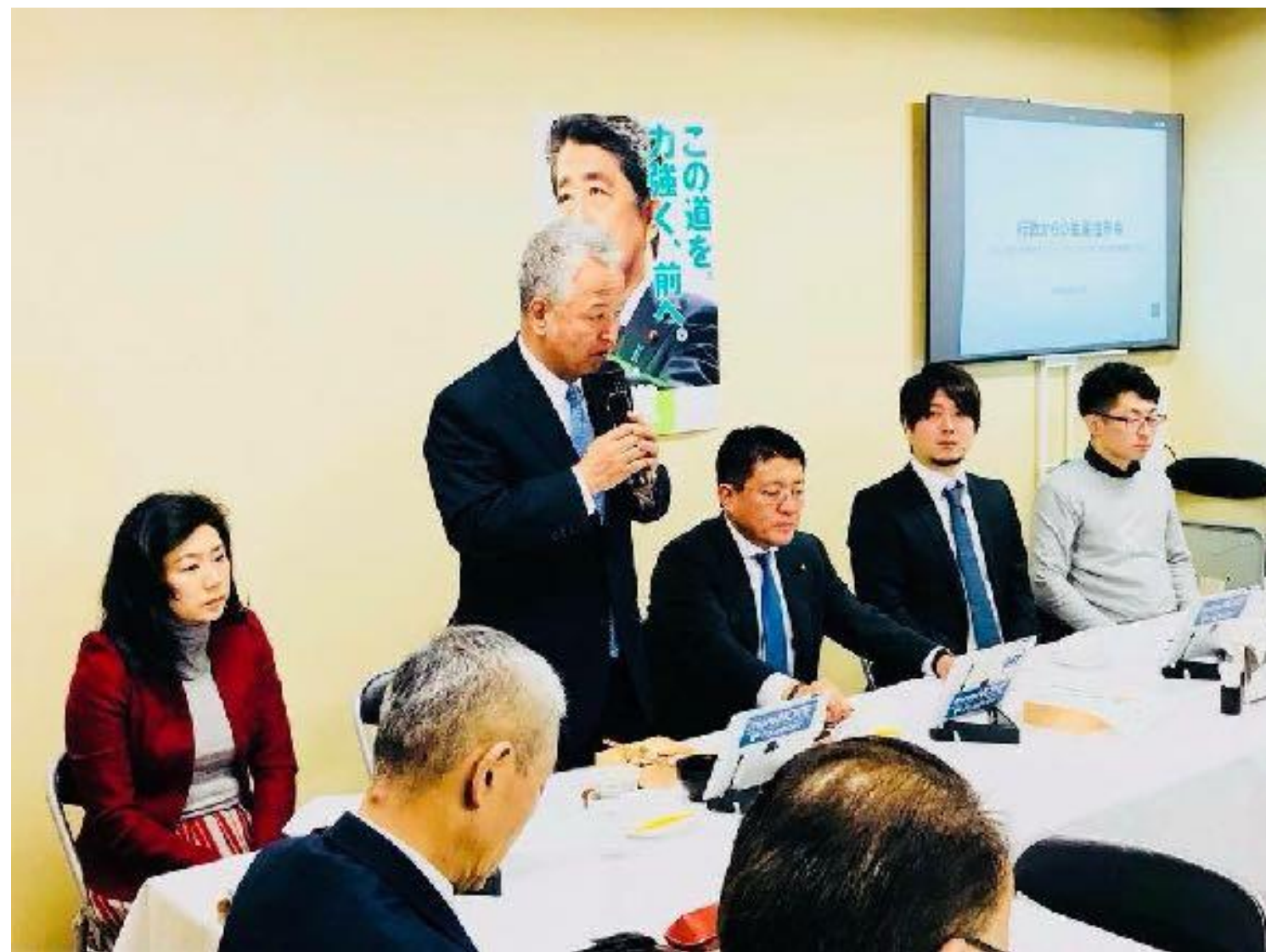
政府へのIT化戦略のご提言

日本の電子契約市場の立ち上がりを支え、政府へのIT化戦略のご提言を始めとし、電子契約の普及とともに、事業を成長させてきました。