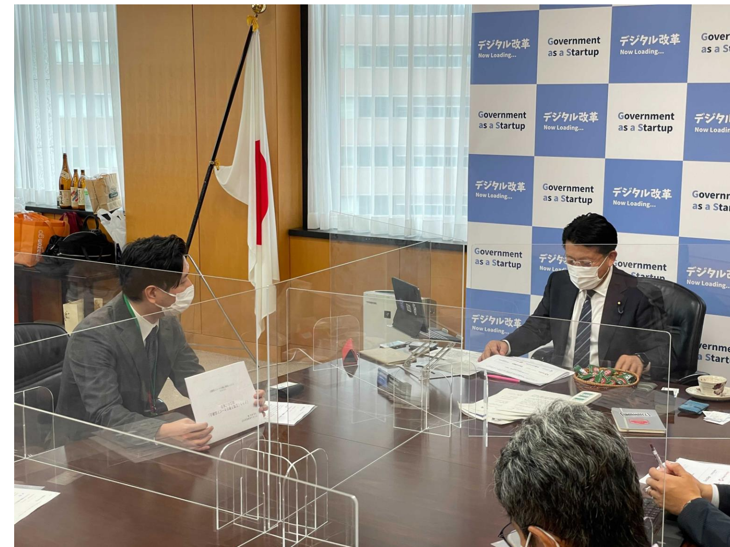
クラウド型電子署名サービス協議会の設立