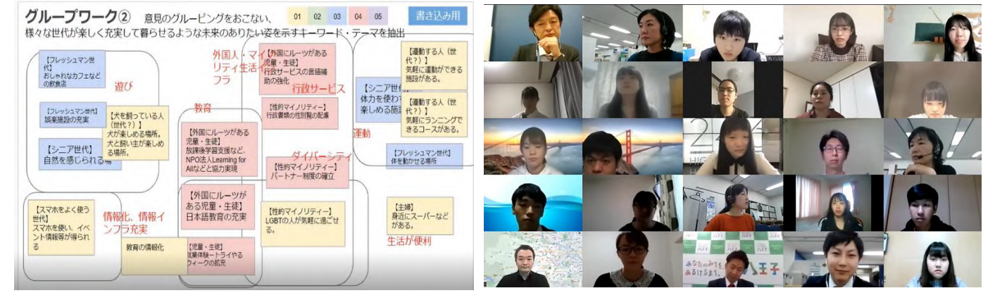
<ワークショップの共有画面>