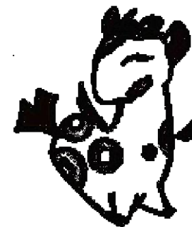
個人住民税PRキャラクター ぜいきりん