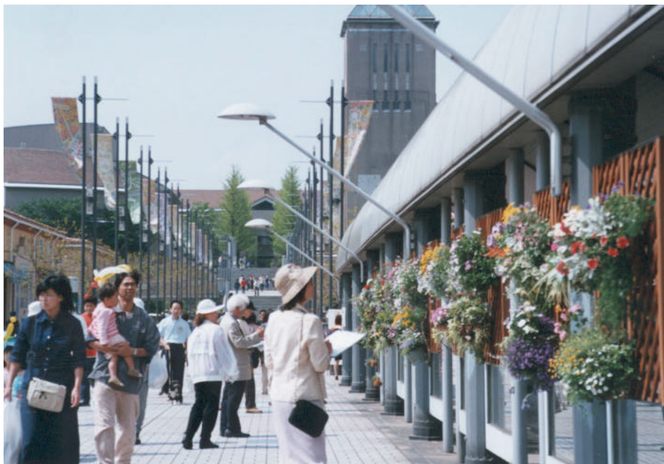
Last Year's Yugi Flower Festival around Minamiosawa Sta.