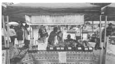
高尾山口マルシェ