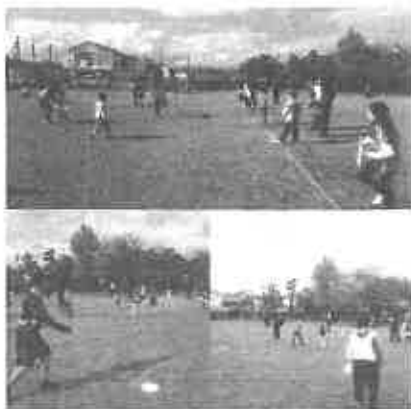
事業の様子または成果がわかる写真①