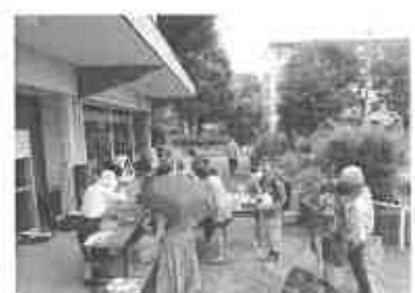
トマトソースとヘビウリカレー作り講習会