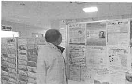
広報活動ポスター掲示状況写真①