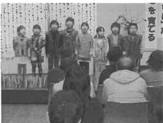
■子ども語り部発表会